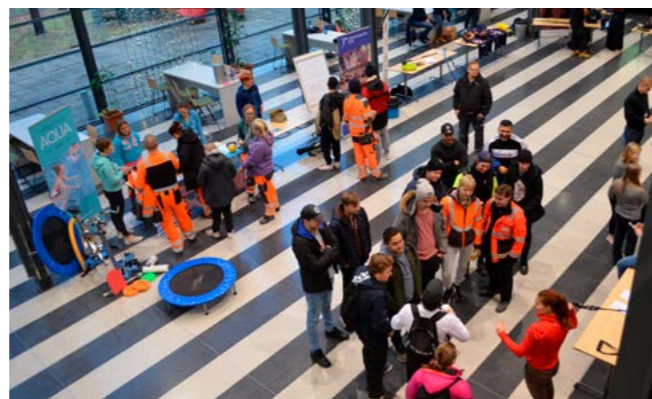
Liikkumisen messut saatiin järjestettyä tammi-kuussa 2020 vielä normaaleissa olosuhteissa. Messuja organisoivat Liikkuva WinNova -hanke.