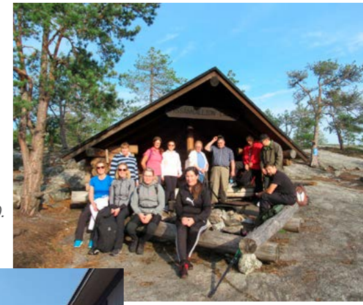
Wirikkeen vauhdissa 2020.

Wirikkeellä on oma Teams-tiimi WinNovan henkilöstölle vuorovaikutukseen ja ideointiin!